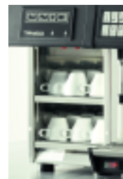
Module Chauffe-tasses Cup Warmer Module

Pour une performance inégalée, et dans une parfaite harmonie, la TANGO® DUO peut être combinée à la TANGO® SOLO, ainsi qu'aux différents modules.